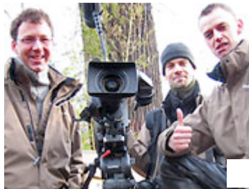
Ein Drehteam im Zoo